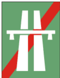
Sfarsit de autostrada

Acest indicator se monteaza la iesirea de pe o autostrada.