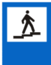
Pasarela pentru pietoni

Are rolul de a informa conducatorul auto ca in apropiere se afla un post de prim ajutor. Pe indicator poate fi inscrisa si distanta pana la respectivul punct.