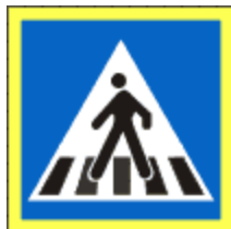
Trecere de pietoni

Acest indicator sa instaleaza in apropierea unei treceri pentru pietoni. Acesta poate fi precedat si de indicatorul Presemnalizare trecere pentru pietoni.