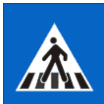
Trecere de pietoni

Acest indicator sa instaleaza in apropierea unei treceri pentru pietoni. Acesta poate fi precedat si de indicatorul Presemnalizare trecere pentru pietoni.