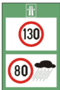
Limite maxime de viteza pe autostrada, in functie de conditiile meteorologice

Acest indicator se monteaza la iesirea de pe o autostrada.