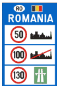
Limite generale de viteza

Acest indicator sa instaleaza in apropierea unei treceri pentru pietoni. Acesta poate fi precedat si de indicatorul Presemnalizare trecere pentru pietoni.